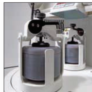
Disponible également : le p-5 classic line avec 2 postes de broyage