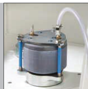
Le PULVERISETTE 4 pour le broyage sous gaz de protection