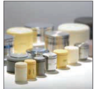
Variée et riche : la gamme des bols de broyage FRITSCH