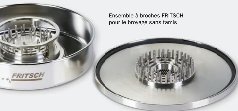
Ensemble à broches FRITSCH pour le broyage sans tamis

Vous ne trouverez cela que chez FRITSCH : pour le broyage sans tamis d'échantillons très difficiles à traiter, de dureté moyenne, contenant des graisses ou des huiles tels que les cires et paraffines, vous équipez la PULVERISETTE 14 avec le rotor spécial à broches et le couvercle correspondant pour l'enceinte de broyage : le broyage s'effectue alors sans aucun tamis.