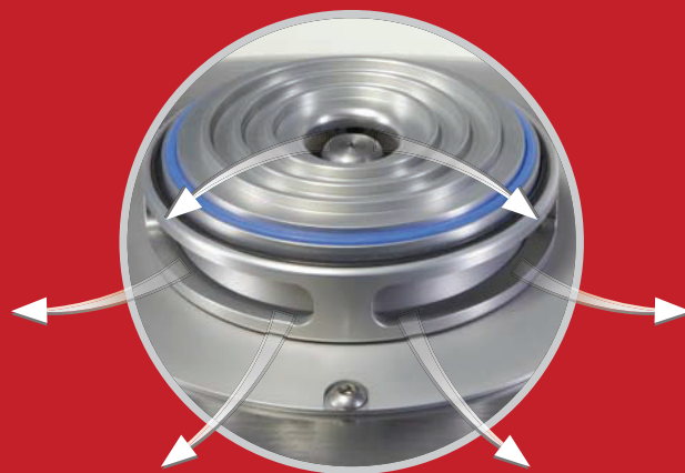
Circulation d'air très étudiée pour un refroidissement efficace de l'échantillon

Vous ne trouverez cela que chez FRITSCH : la circulation d'air dans la PULVERISETTE 14 assure un flux d'air continu sur le rotor, sur le moteur et les outils d'entraînement ainsi que le refroidissement du broyat dans le récipient collecteur. D'autre part un ventilateur de fort débit assure un soufflage d'air frais dans l'appareil, l'air passant par un filtre de retenue des particules. Ce ventilateur crée une surpression et empêche ainsi l'introduction de poussières à l'intérieur.