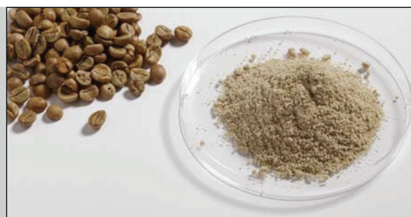
Café brut avant et après le broyage avec la P-14 à 20 000 tours /min et un tamis à passages trapézoïdaux de 1 mm