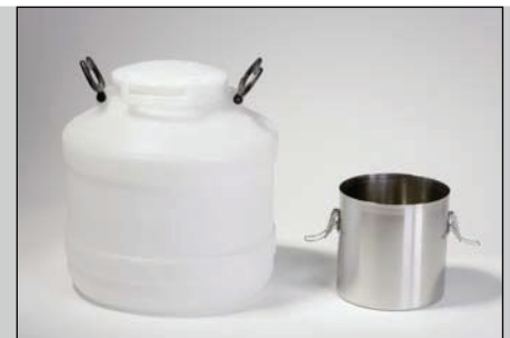
Récipient collecteur de grande contenance 30 l, récipient collecteur de petite contenance 5 l