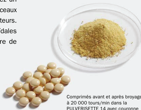
Comprimés avant et après broyage à 20 000 tours/min dans la PULVERISETTE 14 avec couronne de broyage et tamis à perforations trapézoïdales de 2 mm

Pour la préparation d'échantillons dans le cadre de la directive RoHS (détermination de la teneur en chrome hexavalent, etc.), vous équipez la PULVERISETTE 14 avec un rotor à 12 batteurs plus un tamis annulaire à trous trapézoïdaux, tous deux pourvus d'un revêtement en carbure de tungstène.