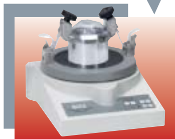
Microbroyeur à vibrations « pulverisette 0 »