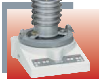
« analysette 3 » PRO pour tamisage de micro-précision