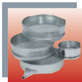
Tamis d'analyse et fond de tamisage