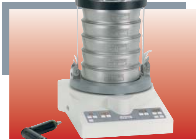
« TorqueMaster »