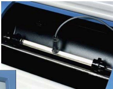
ADP410 instrument avec un tube polarimétrique

Une source DEL et un filtre interférentiel anti-parasite assurent l'éclairage de l'échantillon et ne nécessitent aucun entretien.