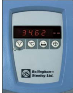
ADP410 panneau de commande